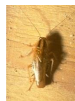
チャバネゴキブリ成虫 Blattella germanica

弊社では、モニタリング調査を重視し、生息場所へのピンポイント目撃、薬剤の適宜使用により、省薬剤（レスケミカル）施工を実現します。また、駆除後も定期的に訪問点検することで、再定着を確実に予防します。